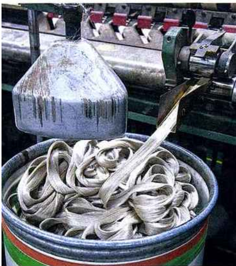
Bożena Ziaja, 42 ans, fileuse, prépare les bobines de 800 g de lin destinées au tissage, dans l'une des deux unités de production polonaises de Safilin.